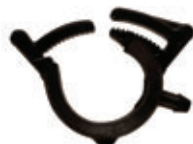
ABRAZADERA DERIVACION INTEGRADO INTEGRAL DRIPLINE TAKE-OFF ADAPTER CLAMP