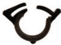
ABRAZADERA TAPON INTEGRADO INTEGRAL DRIPLINE PLUG CLAMP